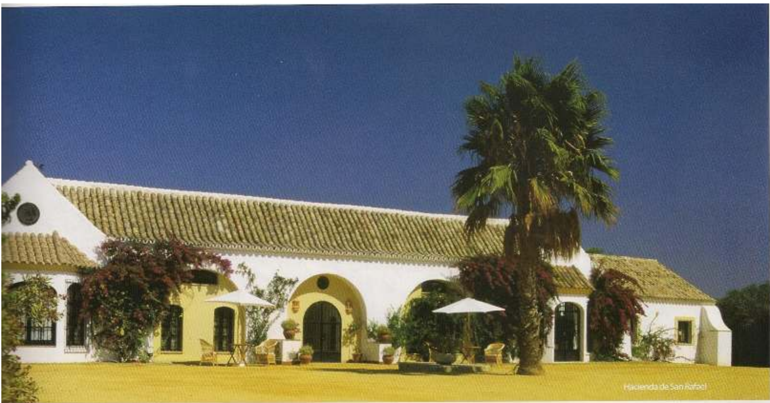
Hacienda de San Rafael