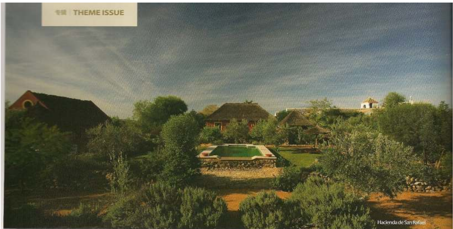
Hacienda de San Rafael